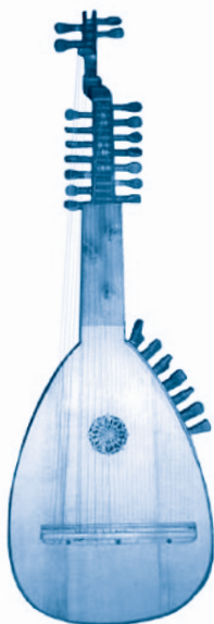
[ tiorba ]

tonalidad. Sistema musical definido por el orden de los intervalos dentro de la escala de los sonidos.