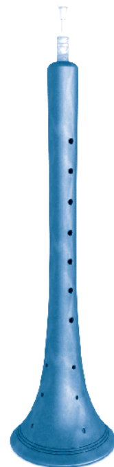
[ zurna ]