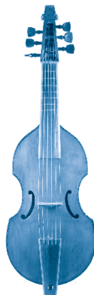
[ viola da gamba ]