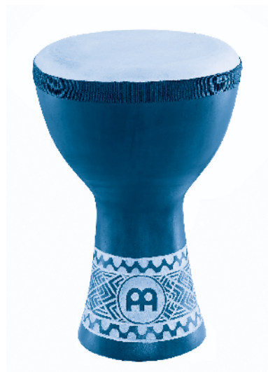
[ derbake ]