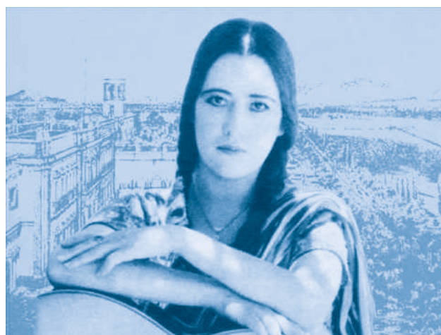
[ Lucha Reyes ]