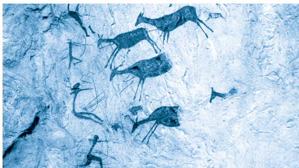
[ Pintura rupestre de la Cova de Cavalls (cueva de los caballos), en Valencia, España ]