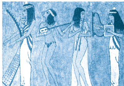
[ Músicos egipcios en celebración ]

Las necesidades humanas, aunque siempre sean las mismas, cambian según el contexto. De igual manera, cada cultura tiene una forma de pensar que determina su labor artística.