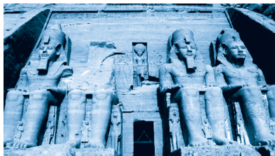
[ Templo de Abu Simbel, en el sur de Egipto ]