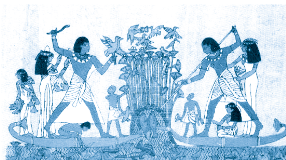
[ Cultivo de papiro en el Nilo ]

Ahora vámonos al antiguo Egipto. Revisa estas imágenes y reflexiona cómo pudo haber sido el contexto en el que se generaron.