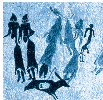
[ Pintura rupestre ]