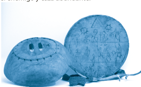
[ Tambor prehistórico ]

Además de manifestaciones musicales, en la Prehistoria hubo pintura, escultura y danza. Las pinturas rupestres solían tener un uso ritual para fomentar el éxito en las cacerías, mientras que muchas esculturas representaban mujeres de grandes senos y amplias caderas para simbolizar la fertilidad. La danza, por su parte, solía emplearse para adorar a los dioses y pedirles mejores cosechas, victoria sobre el enemigo y caza abundante.