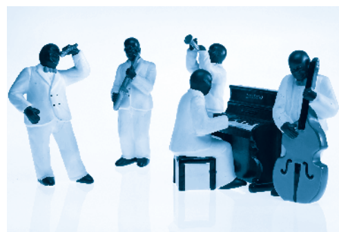
[ Ensamble de jazz ]

polirritmia. Combinación simultánea de dos o más ritmos diferentes.