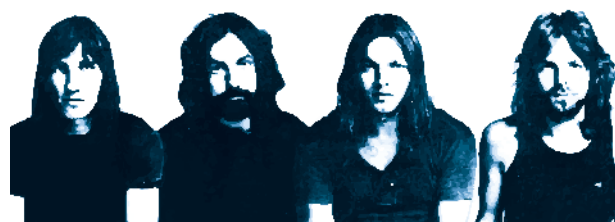
[ Grupo de rock clásico ]

Una agrupación de rock tiene casi siempre una alineación formada por una o dos guitarras eléctricas, batería, bajo eléctrico y un vocalista; a partir de ahí pueden incorporarse todos los instrumentos que te imagines. El rock encuentra sus influencias en estilos como el jazz y el blues , y toma su inspiración, sobre todo, de los temas que aquejan a los jóvenes de cada época.