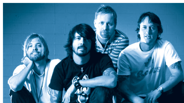
[ Grupo de rock reciente ]